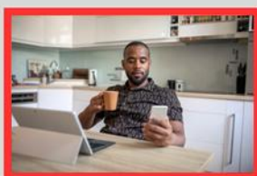
医師による オンラインでの診察