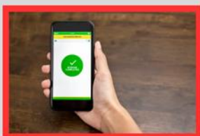
オンラインで受診予約