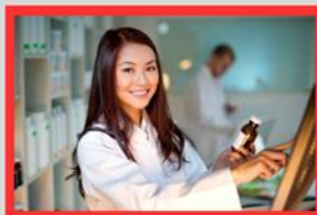
薬剤師による オンラインでの説明