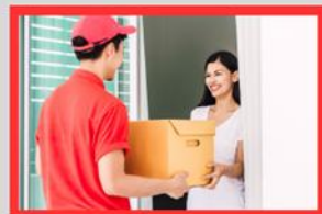
ご自宅でお薬の受取り

オンライン診療は、通院負担の軽減や医療へのアクセス向上につながるサービスです。 誰でもいつでも利用が可能です。 対面診療と上手に使い分けながら、ご自身の健康管理にお役立てください。